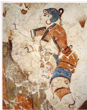
Saffron gatherer, fresco, Akrotiri

參觀克里特島外保存最完好的米諾斯遺址 – Akrotiri，錫拉史前博物館 Museum of Prehistoric Thera，錫拉考古博物館 Archaeological Museum of Thera，Santozeum博物館。晚上享受日落遊船。