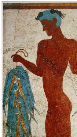
Fresco of a fisherman